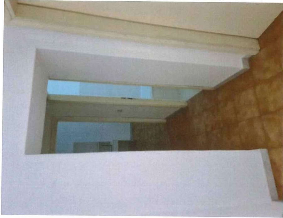
Fotografia B.7 - Foto interna 4