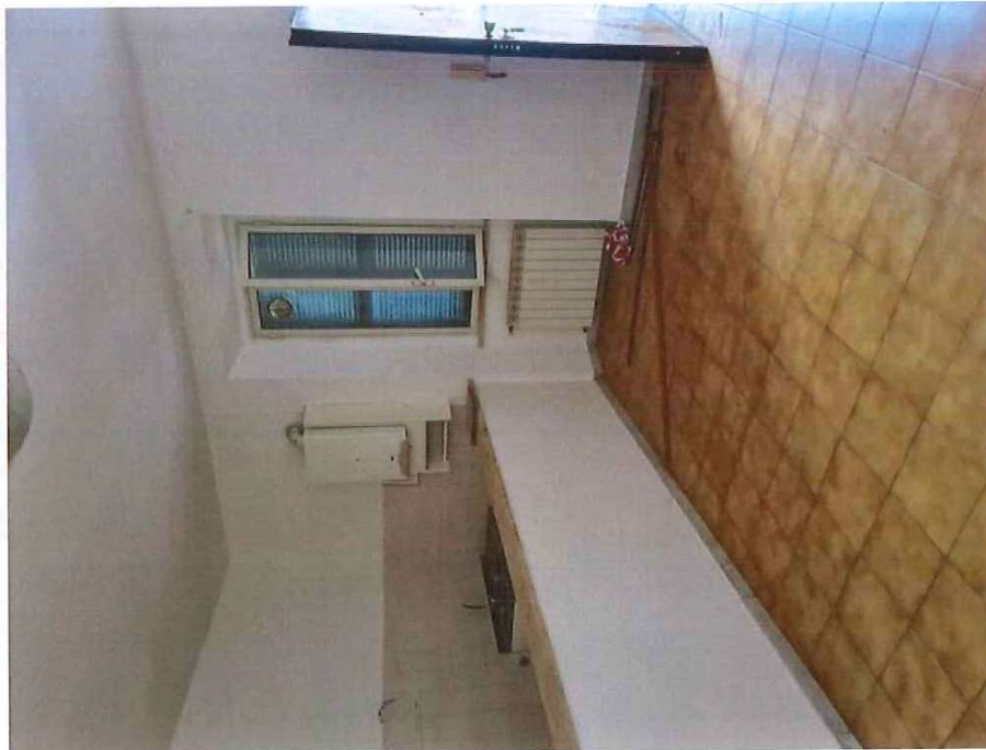
Fotografia B.6 - Foto interna 3