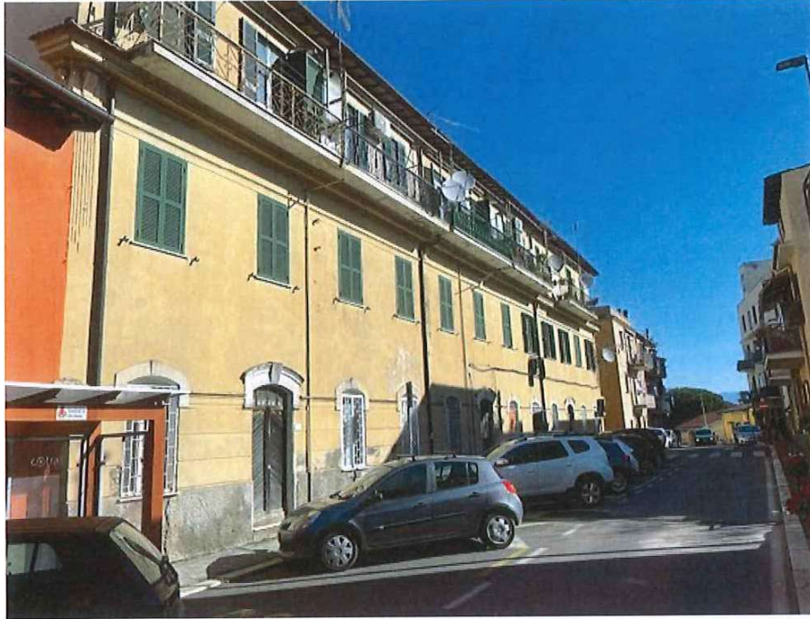
Fotografia B.9 - Foto esterna