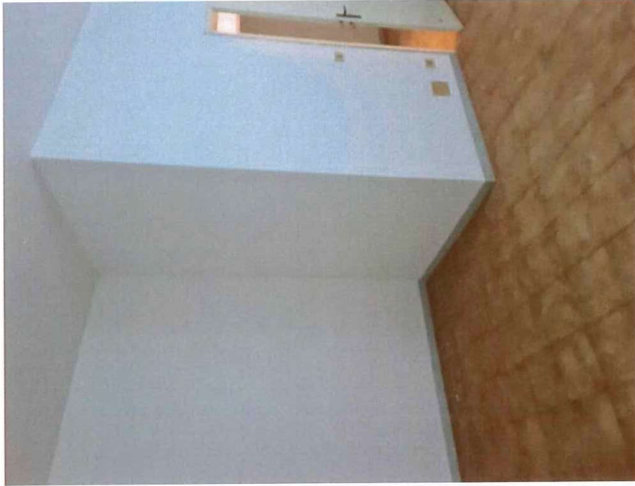
Fotografia B.5 - Foto interna 2