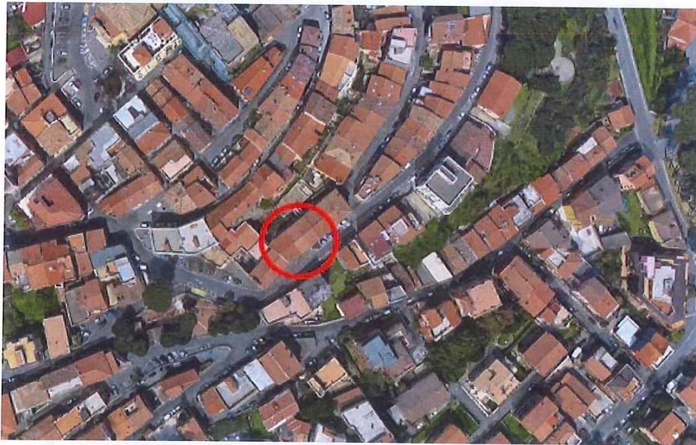
Fotografia B.8 - Vista aerea